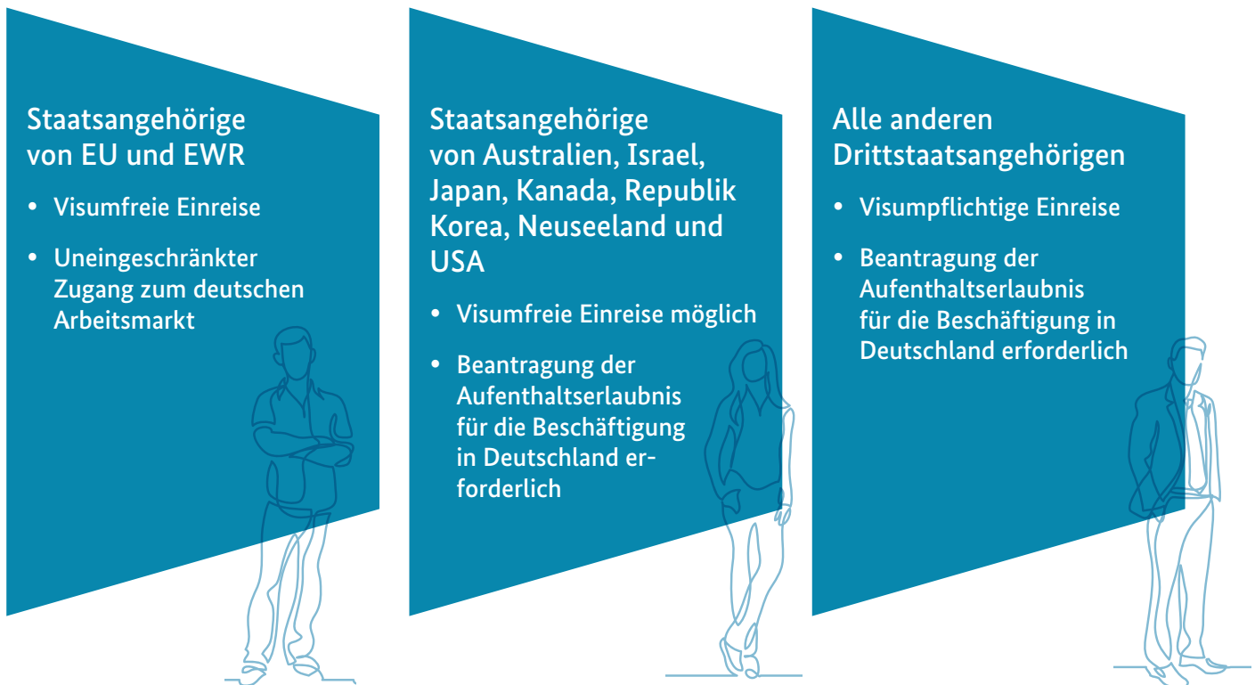
Abbildung 1: Zugang zum Arbeitsmarkt - Wer braucht ein Visum?

Die Bundesrepublik Deutschland hat, was die Einreise und den Zuzug von Fachkräften betrifft, mit einigen Staaten besondere Abkommen, die eine visumfreie Einreise ermöglichen. Für alle anderen gelten je nach Einreisezweck unterschiedliche Visaregelungen.